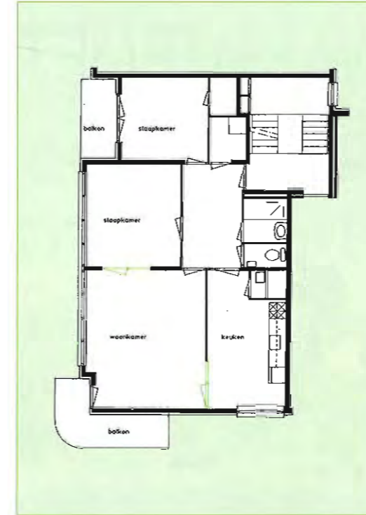
Dapperstraat/Von Zesenstraat. De woonkamer kan worden verbonden met de keuken of met een slaapkamer.