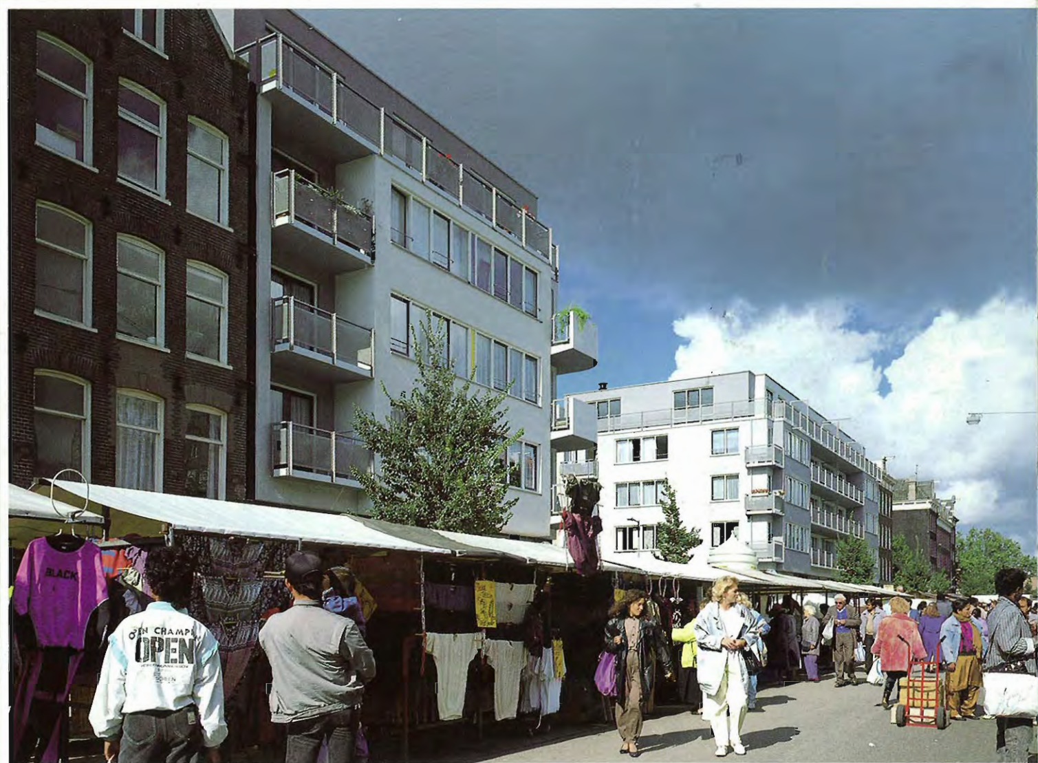
"Nieuwe ruimtelijkheid" in Amsterdam